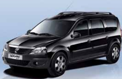
LOGAN MCV AB